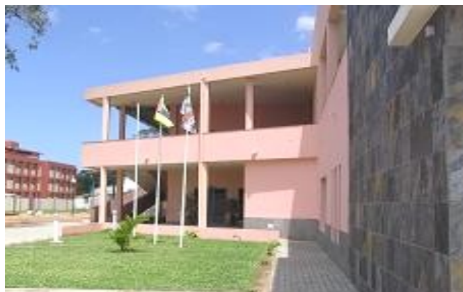
Vista das instalações da CEPED (Centro Provincial de Educação à Distância ) em Maputo