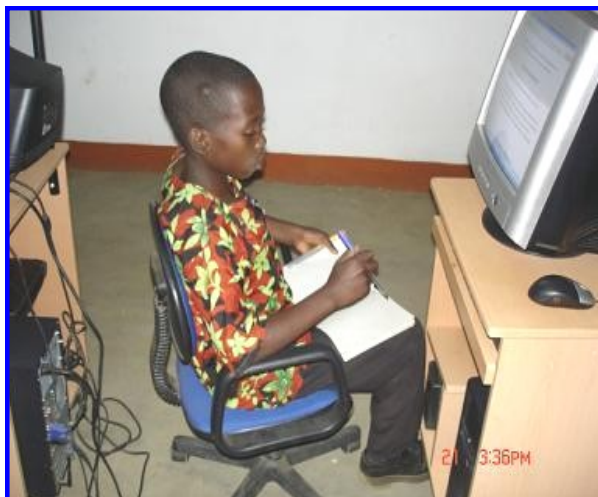
aluno do PESD no CAA de Malema estudando modulo

NB: A certificação é feita pela direcção da escola que responde pelo CAA