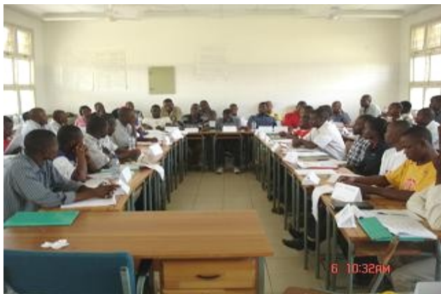
docentes de disciplina durante a capacitação em matérias de ensino a distancia em Vilankulos-Inhambane

Promover a formação à distância de professores em exercício e de cidadãos não cobertos pelo sistema do ensino presencial e ou outros com outras necessidades .