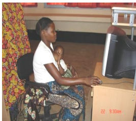
aluna do PESD no CAA de Ribaué

O Instituto de Educação Aberta e à Distância (IEDA), é uma instituição Moçambicana de Ensino à Distância, criada em 2005, como resultado da fusão do Instituto de Aperfeiçoamento de Professores (IAP) e o Departamento de Educação à Distância (DED), com a aprovação em 29/07 pelo Conselho Nacional da Função Pública do Estatuto do Ministério da Educação e Cultura.